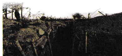
Celebrele tranșee de la Verdun