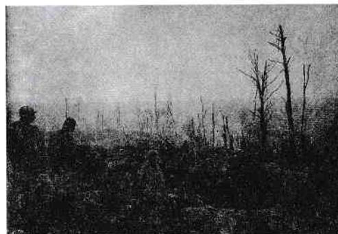
Regiunea Fortificată Verdun