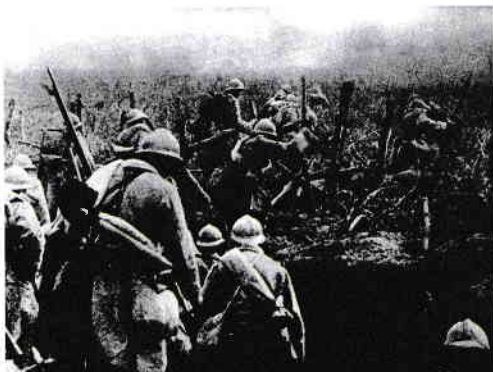
Soldați francezi, în tranșee

6. Fișa unei bătălii istorice: Bătălia de la Verdun, 1916. Documentează-te de pe istoria.ro sau de la bibliotecă și completează rândurile de mai jos.