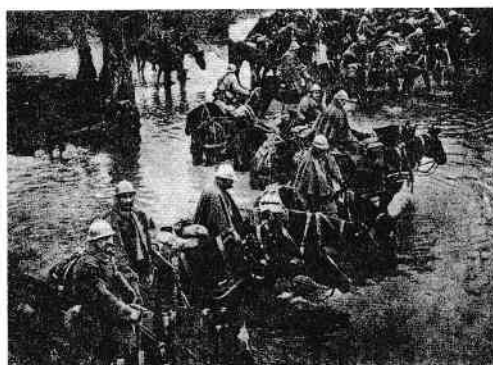
La Verdun s-a dat „bătălia bătăliilor” din Primul Război Mondial